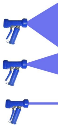
AKRBT01-B-U AKRBTB1-B-U (große Durchfluss)

Alle fettgedruckten Typen sind ab Lager lieferbar