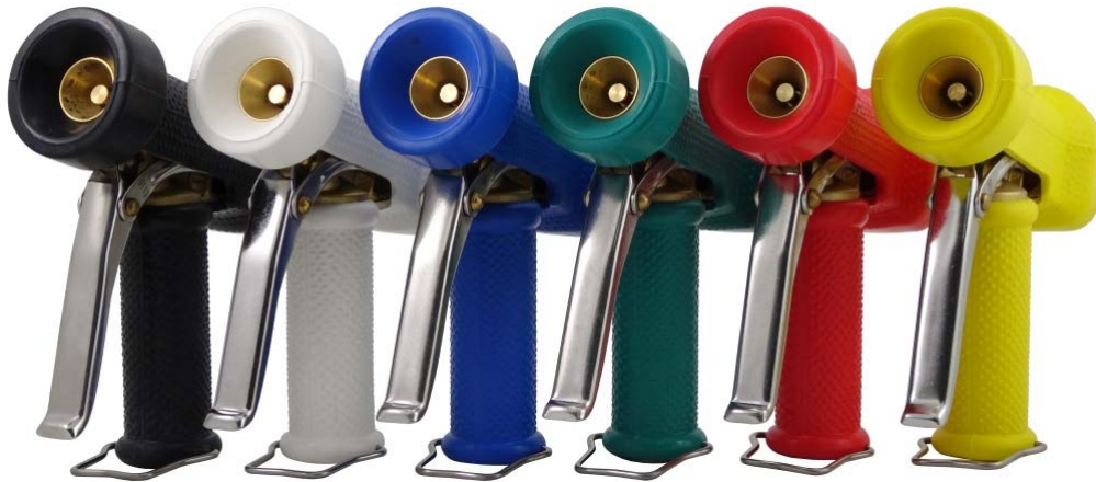
KLMN001-BL zwart KLMN001-B blauw KLMN001-R rood KLMN001-W wit KLMN001-G groen KLMN001-Y geel

Alle vetgedrukte types zijn uit voorraad leverbaar