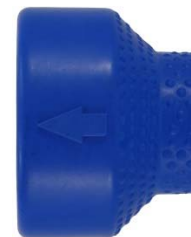
Pijl voor de straalrichting

*** Hoewel alle materialen temperaturen van boven de 100 °C aan kunnen, wordt aanbevolen speciale voorzorgsmaatregelen te nemen als heet water wordt gebruikt.