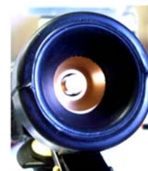
Sortis grand débit