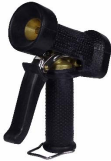
AKMB001-BL AKRB001-BL (RVS 316)

Met onverliesbare handgreep en met geïsoleerde RVS-bedieningshendel Met geïsoleerde RVS-triggerbeveiligingsbeugel