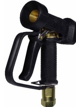
AKMBP01-BL-SWM14-3/4 met kogelgelagerde messing swivel 3/4" bi. dr.

Alle vetgedrukte types zijn uit voorraad leverbaar