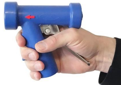
Deutlich sichtbare rote Strahlrichtungspfeile

Alle fettgedruckten Typen sind ab Lager lieferbar