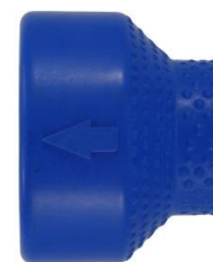
Pijl voor de straalrichting