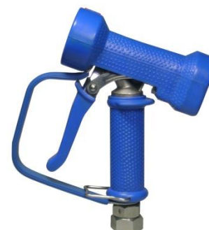
AKCNP01-B-SWC09-1/2 AKCNP01-W-SWC09-1/2 Met messing verchromde swivel 1/2" BSP bi. dr.

Alle vetgedrukte types zijn uit voorraad leverbaar. *NPT draad aansluiting