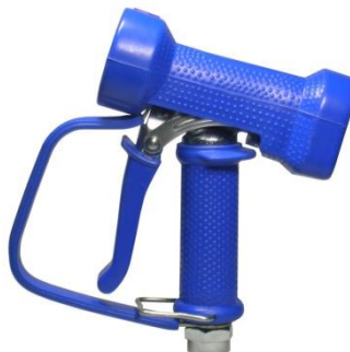
AKCNP01-B blauw AKCNP01-W wit AKCNP01-W-U* wit